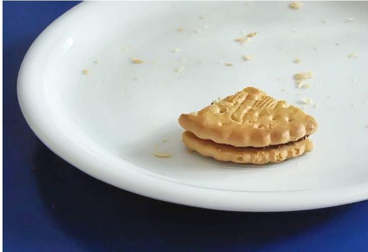
Anna Schulten, 9mk

Glück und Erfolg werden nur dem gegeben, der großmütig einwilligt, beide zu teilen.