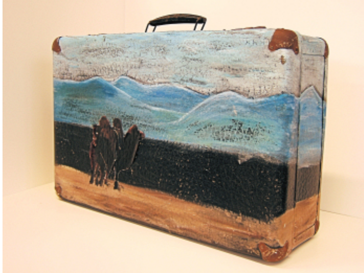
Linea Winter, 10mk

Tag du der Geburt des Herrn, heute bist du uns noch fern, aber Tannen, Engel, Fahnen lassen uns den Tag schon ahnen, und wir sehen schon den Stern.